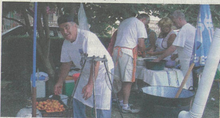
Idén is változatos programok és finom ízek várták az érdeklődőket Kisvejkén, a Kajszi Fesztiválon.