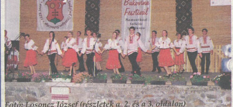
Fotó: Losoncz József (részletek a 2. és a 3. oldalon)