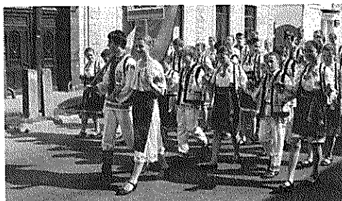
Ukrajnából is érkeztek fellépők a Bukovina Fesztiválra.

A bukovinai székelység hazatelepítése 1941-ben történt meg. Először Bácskában telepítették le a hazatérőket, majd a háború végén a közeledő szovjet csapatok és a jugoszláv partizánok elől menekülők aztán a tolnai, baranyai sváb falvakban és Bács-Kiskun megyében leltek végleges otthonra. A sokat szenvedett népcsoportot összefogó Bukovinai Székelyek Országos Szövetsége szervezésében nálunk 12. alkalommal találkoztak a hagyományörzők a nemzetközi folklorfesztiválon. Külföldről Romániából, Szlovákiából, Lengyelországból és Ukrajnából érkeztek fellépő csoportok Bonyhádra. Az együttesek a szomszédos településeken: Zombán, Kétyen, Kakasdon,