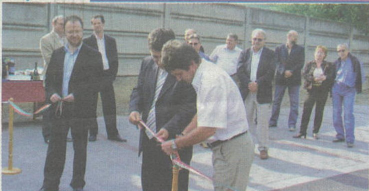
Szilárd burkolatú út és új parkolóhelyek épültek Bonyhádön, az Illyés Gyula utcában.