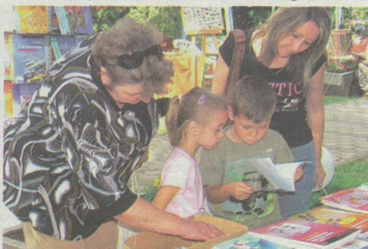
Színes programok várták az érdeklődőket a IX. Völgységi Könyvfesztiválon, Bonyhádön, a Perczel kertben.