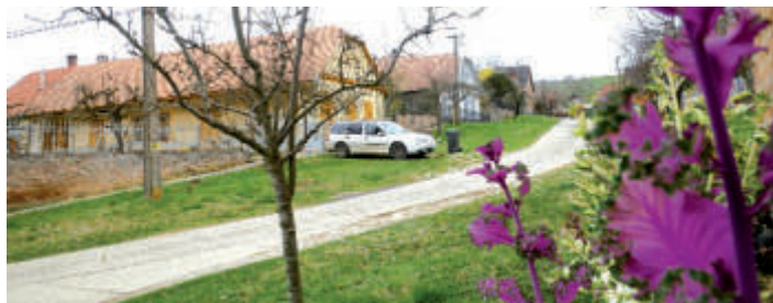
Rendezett utcák jelik, hogy az elmúlt években sok fejlesztés valósult meg