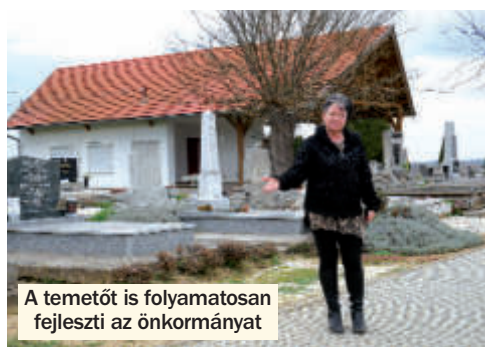
A temetőt is folyamatosan fejleszti az önkormányzat