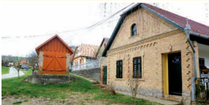
A faluban nagyon sok helyi védettség alatt álló épület van