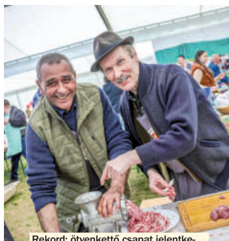
Rekord: ötvenkettő csapat jelentkezett a Majosi Kolbásztöltő Fesztiválra

A 8. Szentgáli Böllérversen egy száz-hús és egy száznegyven kilós disznót kábítottak el, majd szúrtak le, az állatokat a hagyományoknak megfelelően rénfán bontották