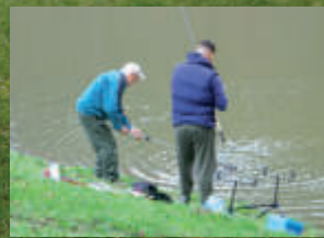
Sok horgász és turista kedvencei a parkerdő tavai, van is miért ide járniuk