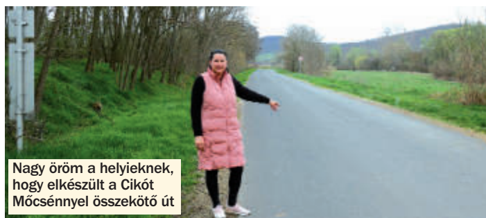
Nagy öröm a helyieknek, hogy elkészült a Cikót Möcsénnyel összekötő út

szolgáló épülettel, és vizesblokkokkal. A pályázati anyagot már összeállították a polgármesteri hivatal munkatársai. A pályázat viszont egyelőre tartalék listára került. Így ha nem is azonnal, de várhatóan ez a beruházás is elkezdődhet idővel a faluban.