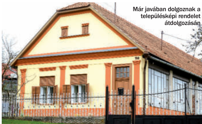
Már javában dolgoznak a településképi rendelet átdolgozásán