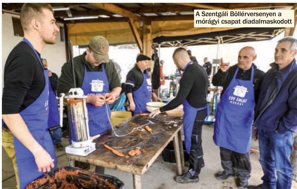
A Szentgáli Böllérversen a mórági csapat diadalmaszkodott

A Zombához tartozó Szentgál-szőlőhegyen is megtartották a már hagyományos Szentgáli Böllérverseny programjait. A megmérettetésre ezúttal a két társszervező egyesület mellett mórági vendégek is érkeztek. Az új csapat ráadásul nem is akármilyen eredménnyel mutatkozott be.