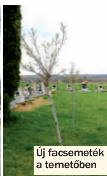
Új facseteték a temetőben