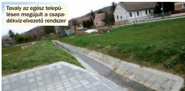
Tavaly az egész településen megújult a csapadékvíz-elvezető rendszer