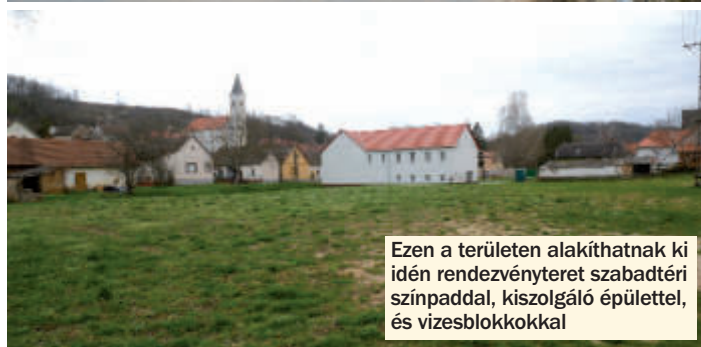
Ezen a területen alakíthatnak ki idén rendezvényteret szabadtéri színpaddal, kiszolgáló épülettel, és vizesblokkokkal