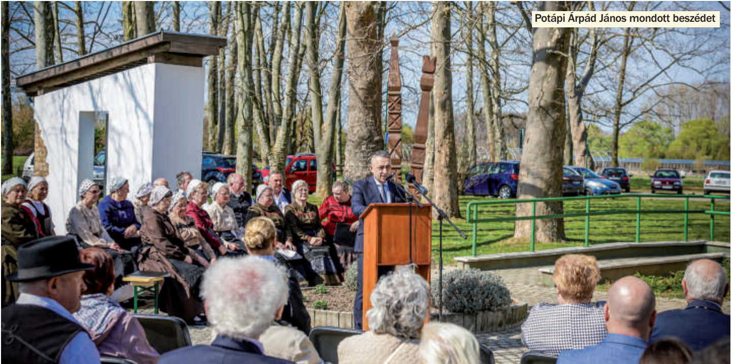
Potápi Árpád János mondott beszédet

NAGYMÁNYOK Egy új emlékművet avattak március 23-án, szombaton a helyi német ajkú elhurcolt, kitelepített lakosságnak, embereknek állítva emléket. Az eseményen Potápi Árpád János nemzetpolitikáért felelős államtitkár, a térség országgyűlési képviselője mondott köszöntőt. Arra biztatta a helyi németeket, hogy őrizzék meg és adják tovább a hagyományukat