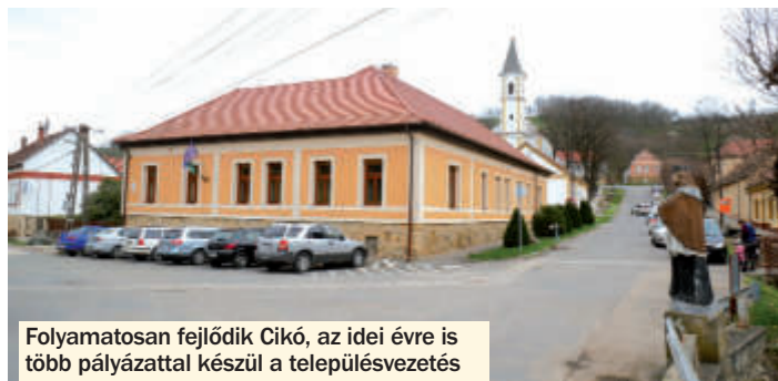
Folyamatosan fejlődik Cikó, az idei évre is több pályázattal készül a településvezetés

A TOP Plusz pályázati rendszer lehetőségeit is igyekezett kihasználni a településvezetés: a képviselő-testület elképzelése szerint a művelődési ház melletti füves területen alakíthatnak ki a jövőben rendezvényteret és közösségi parkot szabadtéri színpaddal, ki-