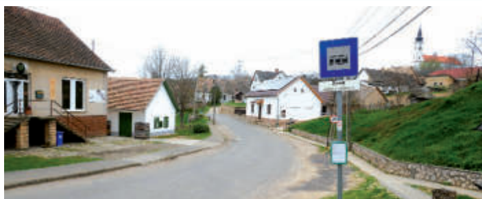
Fontos fejlesztések zajlottak az elmúlt évben Závodon

Mindezek mellett a költségvetést sikerült év végére minimális plusszal teljesíteni. A településnek nem volt tartozása, kifizet-