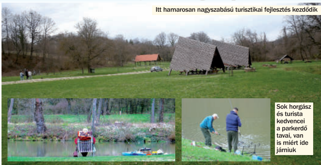
Itt hamarosan nagyszabású turisztikai fejlesztés kezdődik