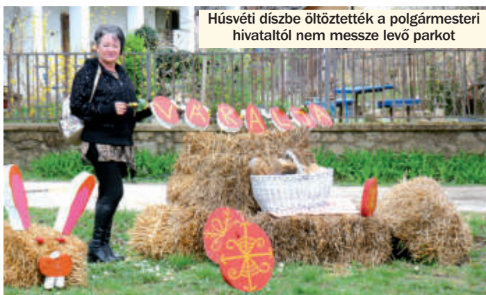
Húsvéti díszbe öltöztették a polgármesteri hivataltól nem messze levő parkot

ezek is pozitív elbírálásban részesülnek. Így, ha minden jól megy, megújulhat a csapadékvíz-elvezető rendszer, a művelődési ház, és a sportpálya öltözője is, ahol szintén sok rendezvényt tartanak.