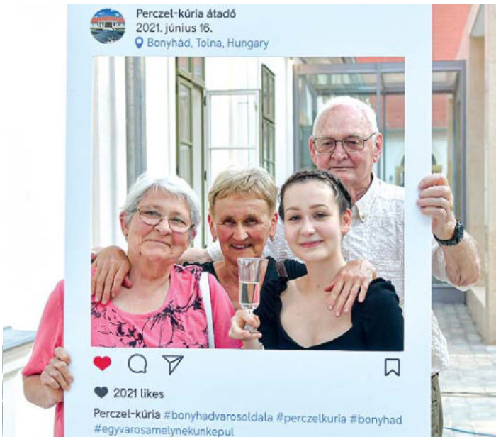
Az eseményre készült selfie-keret is népszerű volt a résztvevők körében