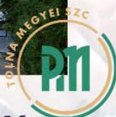
Perczel Mór Technikum és Kollégium