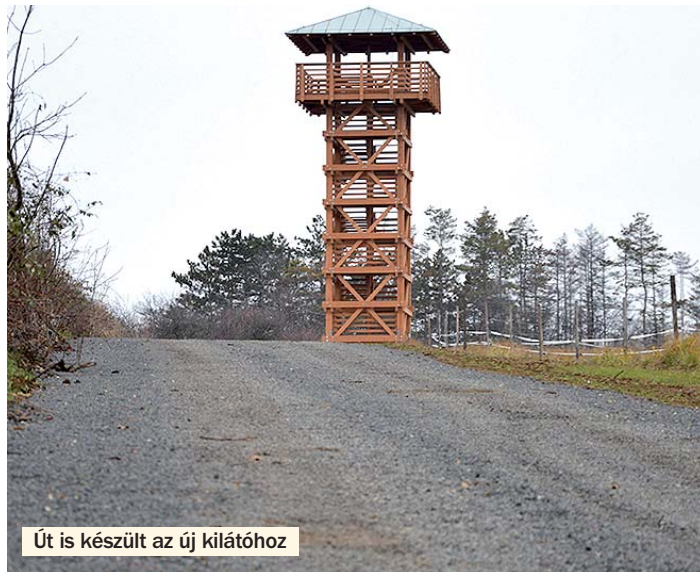
Út is készült az új kilátóhoz

– Tavaly év vége felé elkészült a falu feletti dombtetőn az Apponyi