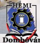
Esterházy Miklós Szakképző Iskola és Kollégium