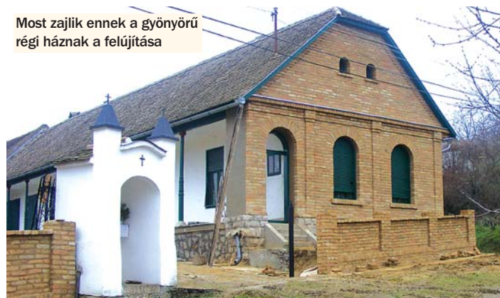
Most zajlik ennek a gyönyörű régi háznak a felújítása