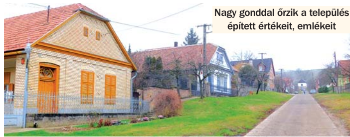
Nagy gonddal őrzik a település épített értékeit, emlékeit

A fentebbiekhez kapcsolódóan tervezik egy kétnyelvű kiadvány