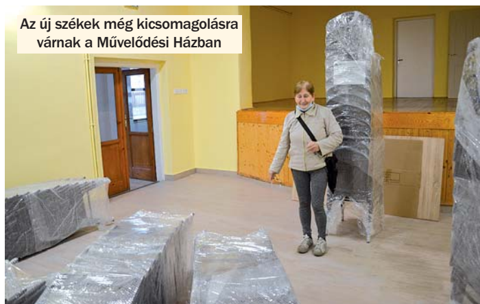
Az új székek még kicsomagolásra várnak a Művelődési Házban

kilátó, amely 11 méter magas. A dombtetőre azonban nem veze- tett végig szilárd burkolatú út. Az- óta ez a gond is megoldódott, pá- lyázati forrásból sikerült a hiányzó útszakaszt leaszfaltoztatni.