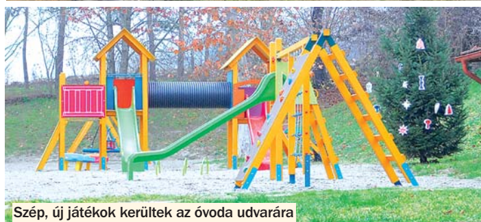
Szép, új játékok kerültek az óvoda udvarára