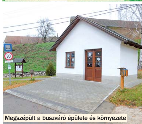
Megszépült a buszváró épülete és környezete

megjelentetését, amelyet főleg az új ingatlantulajdonosoknak szánunk. Ebben tájékoztatnák őket, hogy aki Závodra költözik, milyen környezetbe érkezik, ha védett épületet vásárol, milyen teendői, kötelezettségei vannak, milyen fontosabb helyi szabályokat kell betartani (például belterületi égetés tilalma, zöldhulladék elhelyezés szabályai, ingatlanok előtti közterületek karbantartása, az épületek felújítására vonatkozó szabályok, stb.).