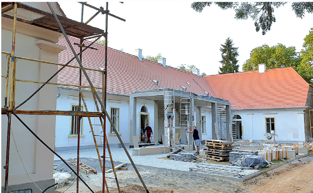
Befejező munkálatoknál tart a Perczel-kúria felújítása, bent épületgépészeti szerelés, kint térkövezés zajlik

BONYHÁD A burkolások és a festés befejeződött a főépületben, mint ahogy a villamoshálózati alapszerelés is. Jelenleg a gépészeti berendezések és a gépház, valamint a szellőztetés kiépítése zajlik. A szerelvényezés, a kertépítés és a térkövezés is folyamatban van. Szeptember közepén, a Hírlevél szerkesztésekor ezek vol-