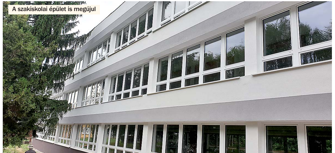
A szakiskolai épület is megújul

ezért pályázati forrást is igyekeztünk igénybe venni. Sikerrel jártunk: 2019 augusztusában a Belügyminisztérium 30 millió forint támogatásban részesítette az önkormányzatot. Az év elején lefolytatott közbeszerzési eljárást követően a kivitelező KÉSZ Kft. feladata a teljes útburkolat cseréje és az alatta lévő vízi közművek rekonstrukciója is, azaz a meglévő régi, elavult anyagú ivóvíz- és szennyvízvezeték csőanyagok cseréje, valamint a csapadékvíz elvezető rendszernek, az utca teljes hosszban történő kiépítése. Mint azt bizonyára már megtapasztalták: a munkálatok javában zajlanak, sőt, az ivóvíz-rekonstrukciós részfeladat már befejeződött és kiépült az új ivóvízhálózat. A beruházást 2020 november végéig kell befejeznie a kivitelező, addig is kérjük a lakók és az arra közlekedők megértő hozzáállását és türelmét.