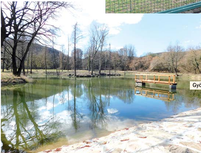
Gyönyörű a parkerdő

A polgármester elmondta: támogatást igényeltek a hivatal épületének, utak, járdák rekonstrukciójára, valamint az óvoda udvarának felújítására. Hangsúlyozta, minden lehetséges pályázaton elindulnak, mert csak támogatással tudnak fejlesztéseket végrehajtani.