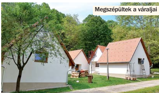
Mezsgépültek a váraljai pihenőházak

Kiadó: Völgységi Önkormányzatok Társulása Székhely: 7150 Bonyhád, Széchenyi tér 12. Honlap: www.vot.hu ; E-mail: vot7151@gmail.com Felelős kiadó: Filóné Ferencz Ibolya Szerkesztő: Árki Attila Nyomdai munka: Böcz Nyomda. Böcz Sándor, Szekszárd Nyilvántartási szám: ISSN-2062-7335, időszakos lap