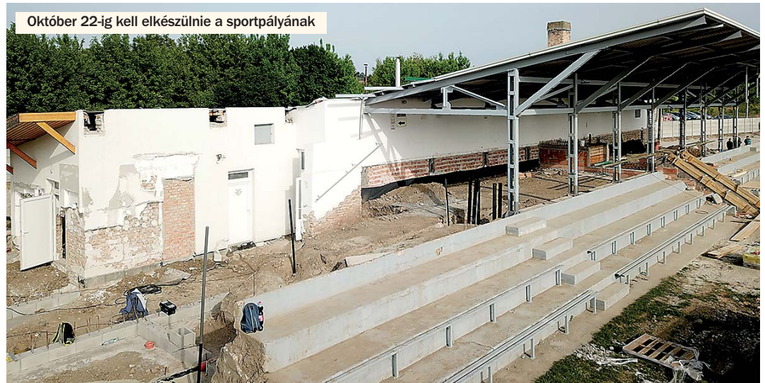
Október 22-ig kell elkészülnie a sportpályának

Egy TOP projekt eredményeként a Váraljai Ifjúsági Tábor már nemcsak az iskolásokat szolgálja. Létrehoztunk egy bakancsos és bringás turisták számára szolgáló turisztikai attrakciót, játszótérrel, kültéri főző- és étkezőhelyekkel, míg a parkerdőben egy száz négyzetméteres fogadóteret a horgászó mellett, esőbeálló, tűzrakóhelyek - padokkal és asztalokkal - kerültek kialakításra. A korszerűsítés első ütemében saját beruhásként a 12 szálláshelyből háromban 12 férőhelyes színvonalas, egész évben használható bakancsos házakat alakítottunk ki. A felújítás második szakaszában - amely idén folytatódott - a tábori szálláshelyekből további 6 házat újítottunk fel. A tetőszerkezettől a homlokzati vakoláson és a nyílászárók cseréjén át a gépészetig, valamint a táborozást későbbi ösztönözhető fűtési rendszer kialakításáig, számos munkafolyamat valósult meg. A júniusban