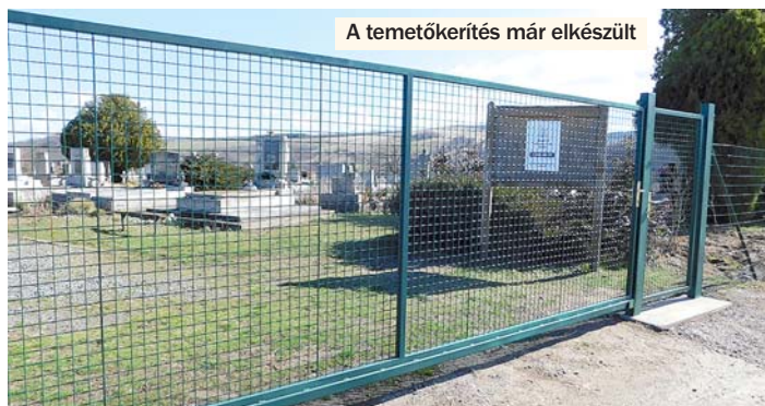
A temetőkerítés már elkészült

összeből 15 millió forintot a művelődési ház vizesblokkjának felújítására, valamint az épület akadálymentesítésére fordítá-