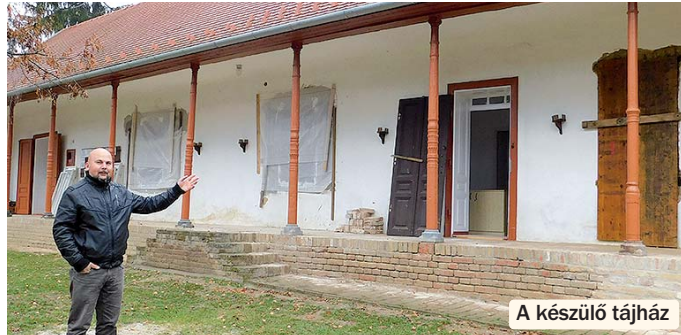
A készülő tájház