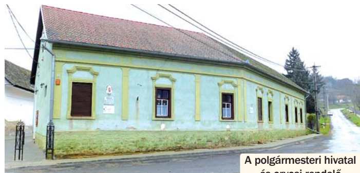
A polgármesteri hivatal és orvosi rendelő épületének homlokzata és udvari része