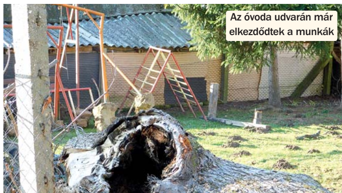
Az óvoda udvarán már elkezdődtek a munkák