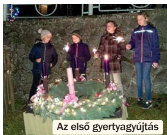
Az első gyertyagyújtás

ben Egyházaskozár, valamint Bikal is a segítségükre van, de átfogó rekonstrukcióra lenne szükség. Ezen felül a belterületi utak rendbetétele is napirenden van.