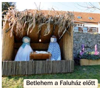
Betlehem a Faluház előtt

A távolabbi tervek között az egyik legfontosabb a Lengyel és Szárász közötti út helyreállítása lenne. Ez a közel két kilométeres külterületi, de önkormányzati tulajdonban levő szakasz nagyon leromlott állapotban van. Próbálják toldozni-foldozni, és megtenni, amit csak lehet, ami-