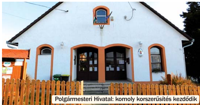
Polgármesteri Hivatal: komoly korszerűsítés kezdődik

ben Egyházaskozár, valamint Bikal is a segítségükre van, de átfogó rekonstrukcióra lenne szükség. Ezen felül a belterületi utak rendbetétele is napirenden van.