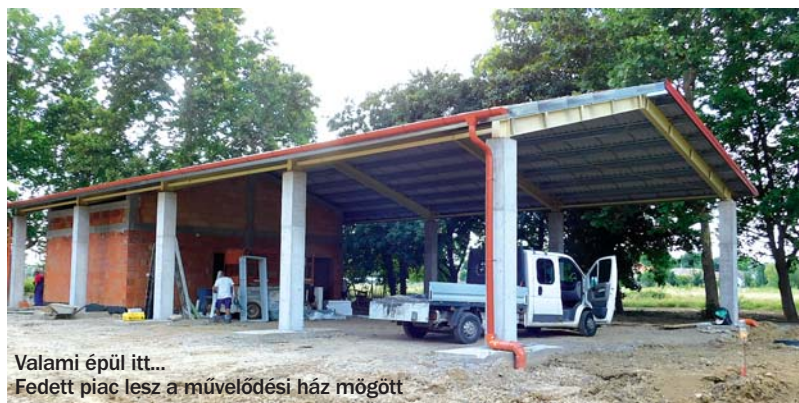
Valami épül itt... Fedett piac lesz a művelődési ház mögött