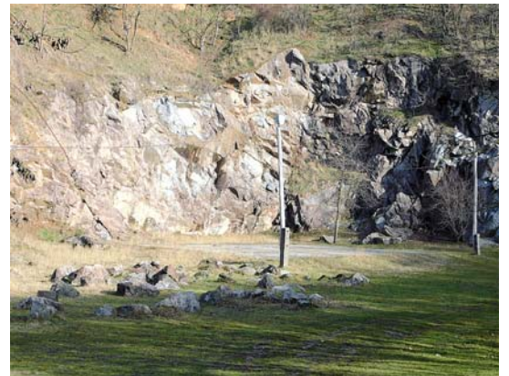
Új szabadtéri színpadot szeretnének a kőfejtőbe

kor elvárásainak megfelelő építmény révén a civil szervezetek – elsősorban a Mórágyi Német Nemzetiségi Néptáncgyűttes – kulturált helyet kapnának a rendezvényeik lebonyolításához, de itt tartanák meg a falunapot, hivatalos nevén a Gránit Fesztivált is.