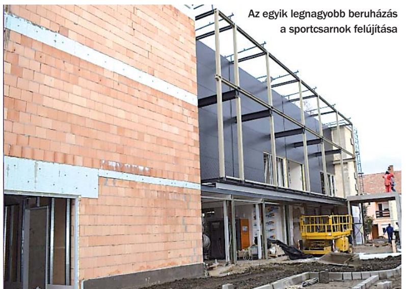
Az egyik legnagyobb beruházás a sportcsarnok felújítása

A Család- és Gyermekegészségügyi központ teljes körű felújítása, illet-