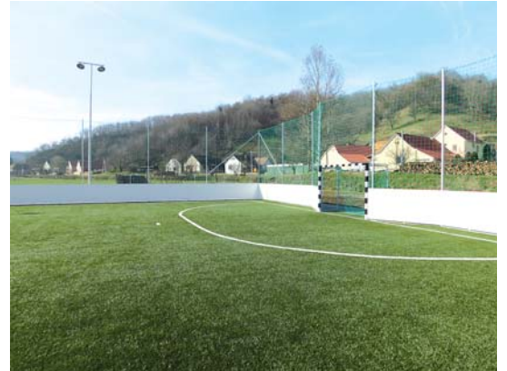
A tavalyi év sikertörténete a műfüves focipálya elkészülte