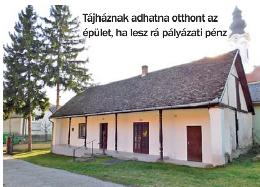
Tájháznak adhatna otthont az épület, ha lesz rá pályázati pénz

Az idei év nagyrészt a megnyert pályázatok kivitelezéséről fog szólni. Költségvetéssel jelenleg még nem rendelkeznek, de az már látható, hogy a 2017-es gaz-