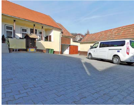
Rendbe tették az önkormányzati épület udvarát

A beruházás révén a közelben található kőbánya is könnyebben elérhetővé vált, ami azért is lényeges, mert az önkormányzat nagyobb szerepet szán neki. Tervezik, hogy új szabadtéri színpadot építenek – az előzőt több mint tíz évvel ezelőtt elbontották, mivel tönkrement. A fedett, a modern