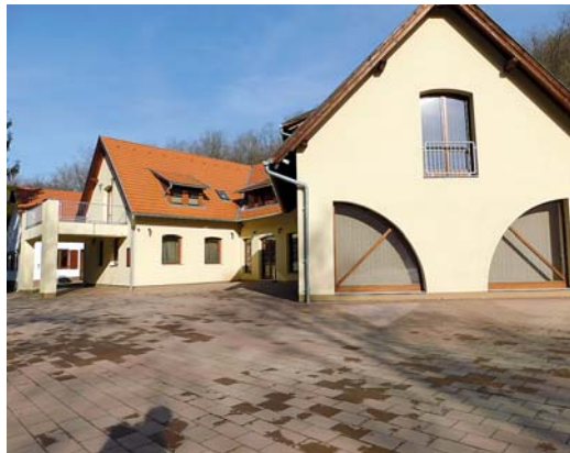
Térkövezték a Gránit Fogadó környezetét