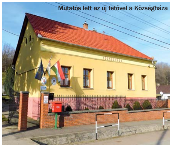
Mutatós lett az új tetővel a Községháza

Szintén gondot jelentetett a Kossuth utca páros oldalának az a 600 méteres szakasza, amelyen még nem burkolták az árktot (ez máshol mindenhol megtörtént már). Mivel a föld nagyobb esőzések alkalmával kopik, a meder egyre mélyebb és szélesebb lesz. Sajnos már előfordult, hogy a kiszélesedett árok a közlekedést veszélyeztette. A település a Tolna megyei önkormányzattal közösen adott be támogatási kérelmet, és közel 22 millió forintot fordíthatnak erre a célra. A beruházás kivitelezése idén kezdődhet majd el, illetve várhatóan be is