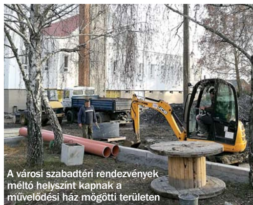
A városi szabadtéri rendezvények méltó helyszínt kapnak a művelődési ház mögötti területen