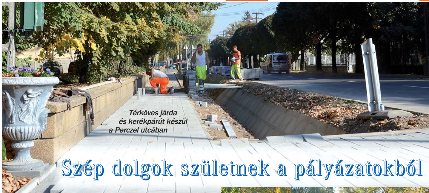
Térköves járda és kerékpárút készül a Perczel utcában