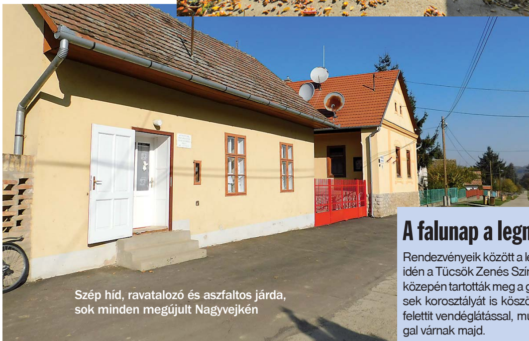
Szép híd, ravatalozó és aszfaltos járda, sok minden megújult Nagyvejkén

Örvendetes, hogy a falu lakossága gyarapodott, 10-12 fő költözött a településre, elsősorban idősebb visszatérők. Ugyanakkor négy gyermek is született. Utóbbi fejlemény is indokolja az önkormányzat egyik további tervének megvalósítását, a játszótér kialakítását. A művelődési ház mögötti területen már most is tudnak játszani, kosarazni, röplabdázni a gyerekek, de a polgármester szeretné még néhány hintával, csúszdával, egy kis kuckóval gyarapítani a helyet. A településnek ugyanis negyven éve nincs játszótéren. Ezen felül tervezik még az orvosi rendelő felújítását nyílászáró cserével, fűtőkorszerűsítéssel.