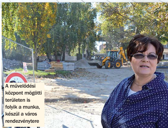
A művelődési központ mögötti területen is folyik a munka, készül a város rendezvénytere

Az ott lakók türelemmel viselik a megpróbáltatásokat – mondta –, amiért a város köszönetét fejezi ki, és természetesen ennek meglesz a jutalma a gyönyörű, új létesítmény képében. Tudni kell, hogy sokan nagyon várják már a