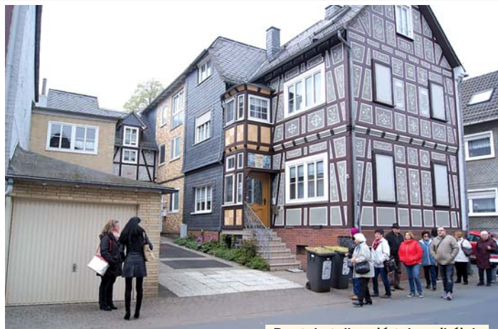
Dautphetalban jártak a cikóiak

Az idei év meghatározó eseménye, hogy a község a Dautphetallal fennálló testvértelepülési kapcsolatának két évtizedes jubileumát ünnepelheti. Április végén ebből az apropóból 34 fős cikói küldöttség utazott Hessen tartományba, ahol rendkívül vendégszerető fogadtatásban részesültek. A három napos látogatás keretében, április 22-én este került sor a jubileumi ünnepségre, amelyen a helyi egyesületek énekarai, tánccsoportja és zenekara lépett fel. A Cikói Székely-Német Hagyományőrző Egyesület kórusa is műsort adott, amelynek részeként egy német dalt is elénekelték. A testvértelepülések képviselői ün-