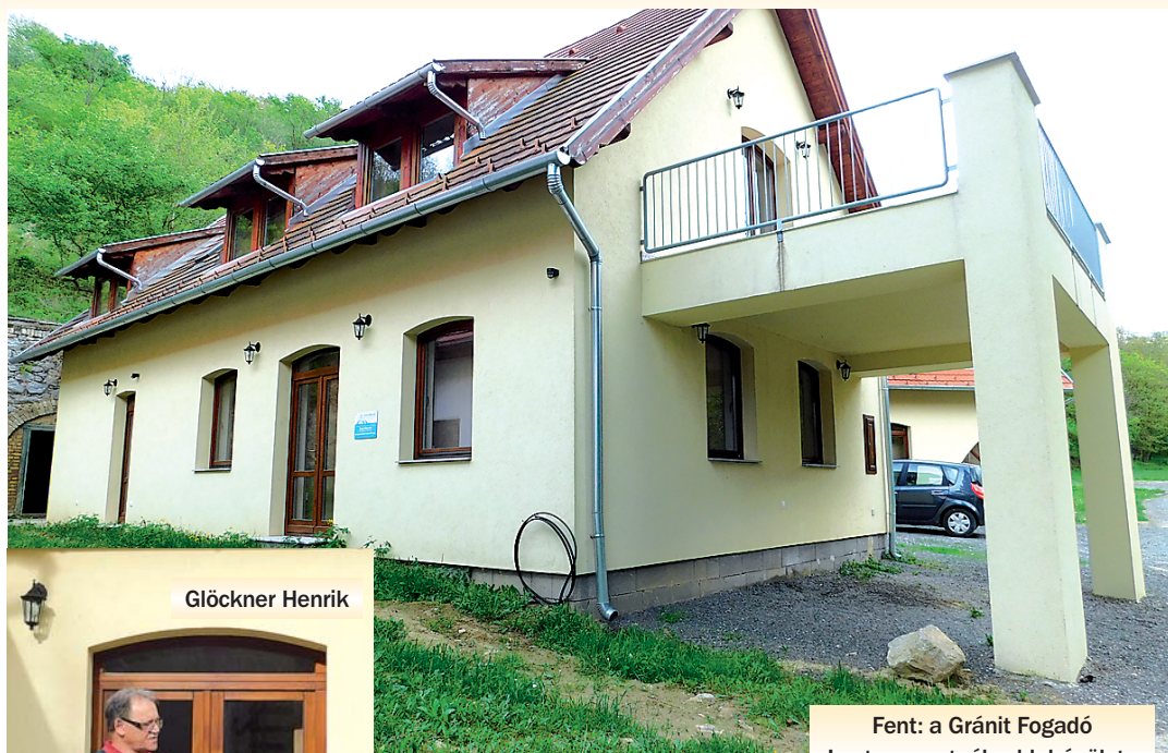
Fent: a Gránit Fogadó Lent: a sportpálya klubépülete mögött lesz a műfüves pálya

Egy korábbi nyertes, de a magas önerő szükséglete miatt be nem váltott pályázat után idén ismét támogatási kérelmet nyújtottak be műfüves futballpálya kialakítására. A már megszületett pozitív elbírálásnak köszönhetően a nagy pályánál található klubépület mögötti területen még idén megvalósulhat majd a kivitelezés.