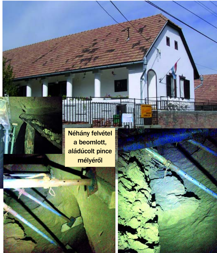
Néhány felvétel a beomlott, aládúcolt pince mélyéről