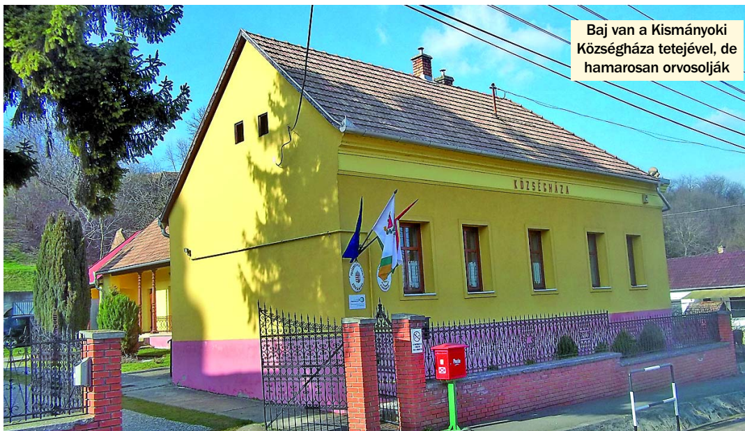
Baj van a Kismányoki Községháza tetejével, de hamarosan orvosolják

– Azt persze hozzá kell tennem – folytatta a polgármester –, hogy komolyabb beruházásra, mint a belterületi utak, a járdák, vagy a középületeink felújítására nemigen gondolhatunk saját erőből, mint ahogy a hozzánk hasonló kistelepülések túlnyomó része is