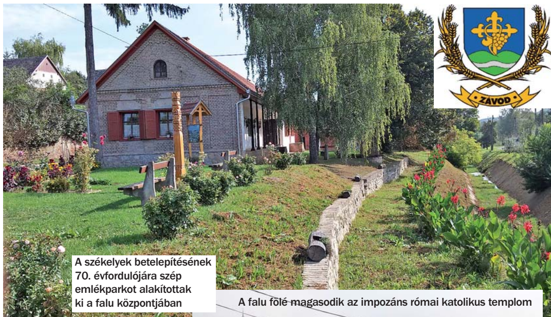
A székelyek betelepítésének 70. évfordulójára szép emlékparkot alakítottak ki a falu központjában

A polgármester arról is büszkén beszélt, hogy – bár anyagi értelemben nagy áldozatot követel a falutól – ez az óvoda nagy kincs Závod számára. Igen magas színvonalú nevelés zajlik az öreg falak között a német nemzetiségi óvodában, amelyet egyébként Tevellel és Lengyellel társulásban működtetnek. A német nyelvet is gyakorolják itt a kicsik, verseket, énekeket és német táncokat tanulnak. Závodi Rimelő néven évente óvodai versmondó versenyt rendeznek a környékbeli települések óvodásai számára. De van ovifoci, illetve rendszeres mozgásfejlesztő foglalkozások és néptánc oktatást is tartanak.