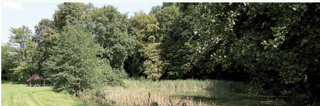
Az alsó tóban (nagy kép) még valamennyi van, de fölötte, a 2. tóban már gyakorlatilag nincs szabad vízfelület, mindent benötte a sás.

Övodák a bonyhádinak tagintézménye, erre is ráférne a felújítás. Itt a bonyhádi központ pályázik, ha nyernek, a Váraljára eső rész 25 millió forint lenne. A konyhát és a vizesblokkot kellene ebből felújítani, és az ovi akadálymentesítését megoldani, illetve, ha még beleférne a költségvetésbe, az udvar egy részét szeretnék leburkoltatni rugalmas lapokkal.