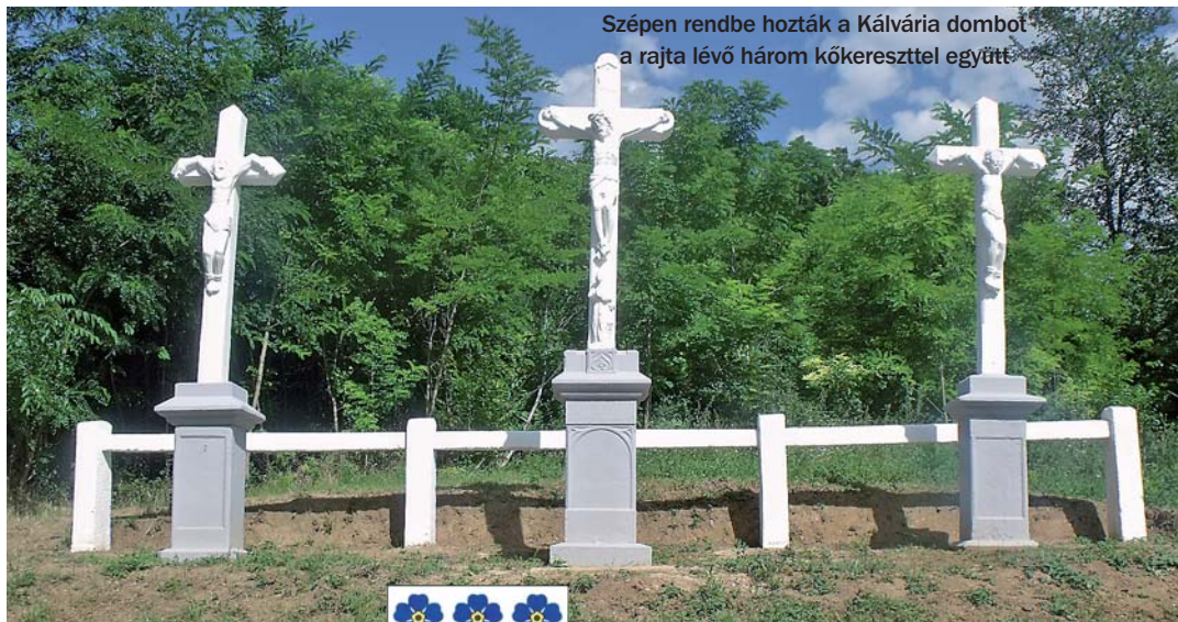
Szépen rendbe hozták a Kálvária dombot a rajta lévő három kőkereszttel együtt

Hatalmas felhőszakadás zúdult Nagyvejkére július 28-án hajnalban. Az óriási, hőmpölygő, sáros víztömeg nagy károkat okozott a falunak, elöntötte az utcák egy részét, kimosta több helyen a partfalat, és megsérült a 2. híd, a lábazatából kimosta a téglákat a nekicsapódó víz. A károk hivatalos felmérése még folyik, ha ez meglesz, erre vis maior pályázatot ad be az önkormányzat. Ha nyernek pénzt a helyreállításra, a falunak sajnos az is sokba fog kerülni, ugyanis 30 százalék az önrész ezeknél a pályázatoknál. Viszont számukra ez nagyon fontos, mert ezen a hídon fordulnak meg a zsákfaluba érkező autóbuszok.