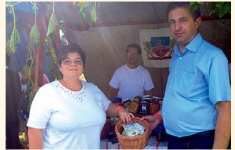
1555 lejt gyűjtött össze a borszéken otthon részére

– Nagy sikerük volt az általunk kínált, Bonyhádra és Völgységre jellemző termékeknek, 1555 lejt gyűjtöttünk össze. Hálásan köszönöm mindazok segítségét, akik hozzájárultak a nemes cél érdekében szervezett akció eredményességéhez – nyilatkozta a polgármester, hozzátéve, hogy a hétvége egésze sikeresnek tekinthető, hiszen tovább erősödött az együttműködés Bonyhád és a Hargita megyei község között.