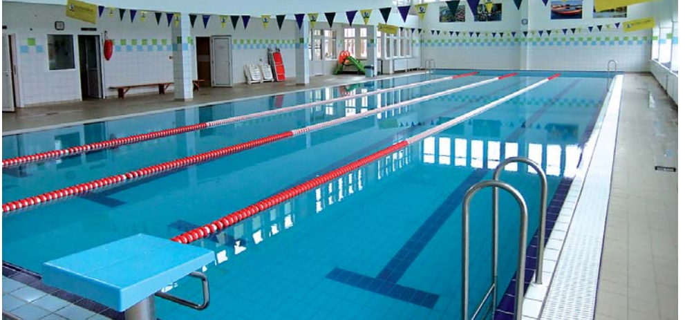
Bonyhád Városi Tanuszoda Bonyhád, Fáy ltp. 34.