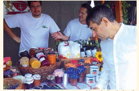
Potápi Árpád János megismeri a vásár kínálatát