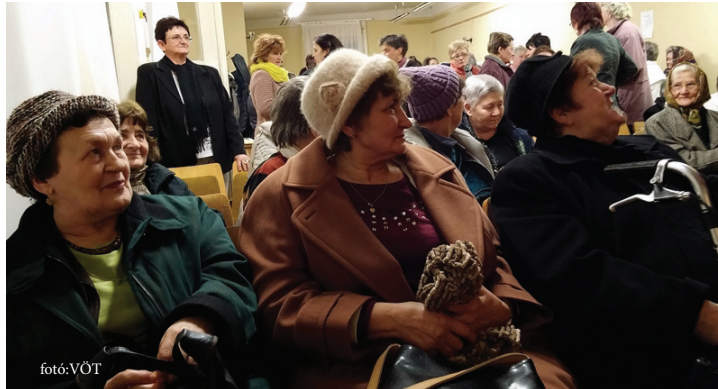
Zsúfolásig megtelt a művelődési ház a közösségi programra