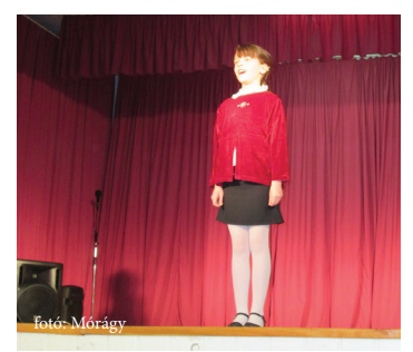
Több fellépője volt az estnek