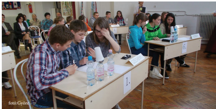
Izgalmas feladatokon keresztül bizonyították tudásukat a diákok