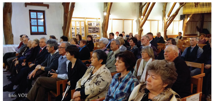
Elismerően szóltak a program résztvevői a rendezvényről és a kötetről

– A szerző – akinek a sors két hazát adott – ma velünk van gondolatban. A szülőfaluja iránti alázatával megírt, és itt kiállított műveivel olyan ívet raj-