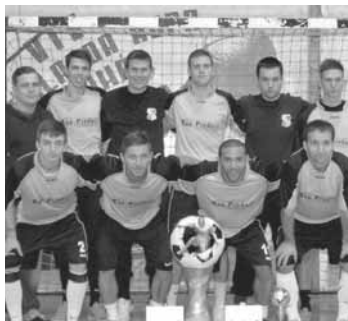
A BENGA KUPA 2012. évi győztese, a Köhler Bau csapata, Fotó: Losoncz József

A profiknál a torna történetének egyik, ha nem legerősebb mezőnyre gyűlt össze, szinte megjósolhatatlan volt a végső győztes kiléte. A zárónapon rendezett profi döntőkre ismét kicsinek bizonyult a bonyhádi csar-