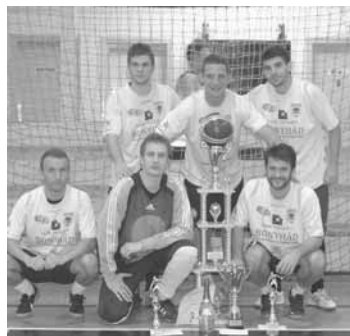
A BOBO FC kupagyőztes csapata

A kupát végül a Bobo FC kaparintotta meg a Bau Product és a Sipos FC előtt. Különdíjak: legjobb játékos: Pap Roland (Bobo FC); legjobb kapus: