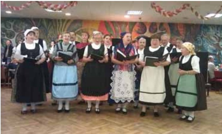
Bonyhádi német kórus

Bonyhád Város Önkormányzata „Iskolabarát Völgységi Múzeum” című TIOP – 1.2.2 -09/1–2010-0023 azonosítószámú Európai Unió által támogatott projektjének köszönhetően, a Völgységi Múzeumi Tanösvény városi útvonalán új megállító tábla üzemel a Szabadság téren. A Völgység és a város térképén apró lámpák gyulladnak ki az egyik oldalon, színes fotók tablója mutatja a másik oldalon a helyi gyűjteményeket, kézműves műhelyeket, épített örökséget, a helyi nevezetességeket és látnivalókat.