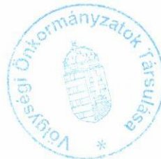
Szarvas Irén főtanácsos