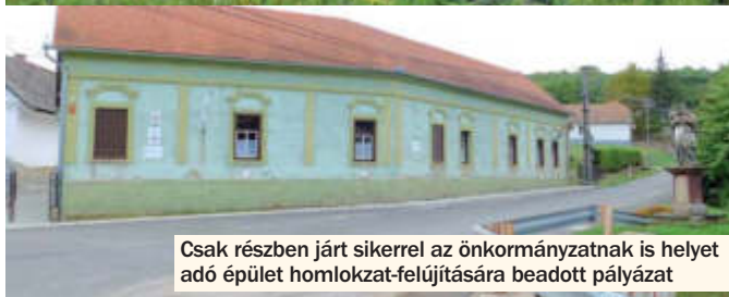
Csak részben járt sikerrel az önkormányzatnak is helyet adó épület homlokzat-felújítására beadott pályázat

megvalósítani a beruházást. Jelen helyzetben önerőből sem tudja kiegészíteni a település a keretet.