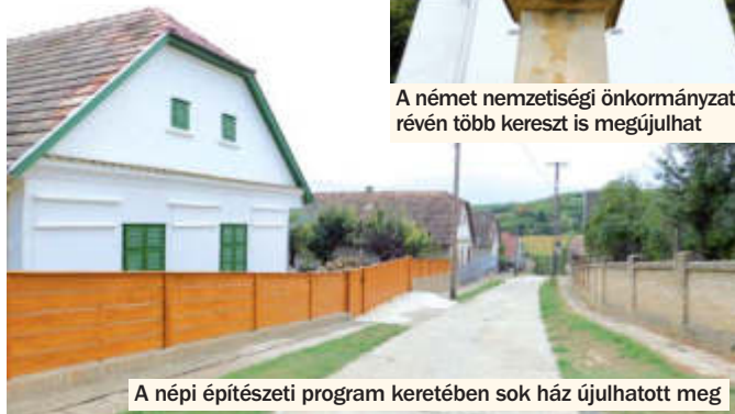
A népi építészeti program keretében sok ház újulhatott meg