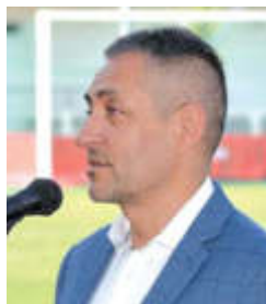
Potápi Árpád János

– 2016-ban két kikötéssel vállalhattam el a Bonyhádi Völgység Labdarúgó Club elnöki szerepét. Az első az volt, hogy a csapat megnyeri a megyei bajnokságot, a második pedig, hogy segítik olyan pályázati lehetőséget találni, melynek keretében teljesen megújul a sportpálya. Mindkét kikötés beteljesült, előbbi nem az én érdemem, hanem a kiváló játékosoké, utóbbi pedig Magyarország Kormányáé – hangsúlyozta.