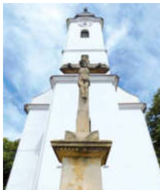
A német nemzetiségi önkormányzat révén több kereszt is megújulhat

beadvány a települést Mucsival összekötő út felújítására 300 millió forintos költségvetéssel. Az érintett burkolat nagyon rossz állapotban van, megoldatlan a vízelvezetése, és ha nem tesznek semmit, féltő, hogy Mucsi zsáktelepülés lesz.