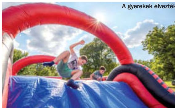
A gyerekek élvezték a sok játéklehetőséget

Természetesen a legkisebbek is megtalálták a szórakozást és a kellemes időtöltést jelentő állomásokat. A trambulint, a testfestést és a lufihajtogatást is kipróbálta az az általános iskolás, akit addigi élményéről kérdeztük. – Szeretném az összes állomást végigjárni mielőtt véget ér a délután. Nagyon jól érzem magam, mások is szívesen részt vennék hasonló rendezvényen – összegezte hatalmas mosollyal az arcán a bonyhádi fiatal.