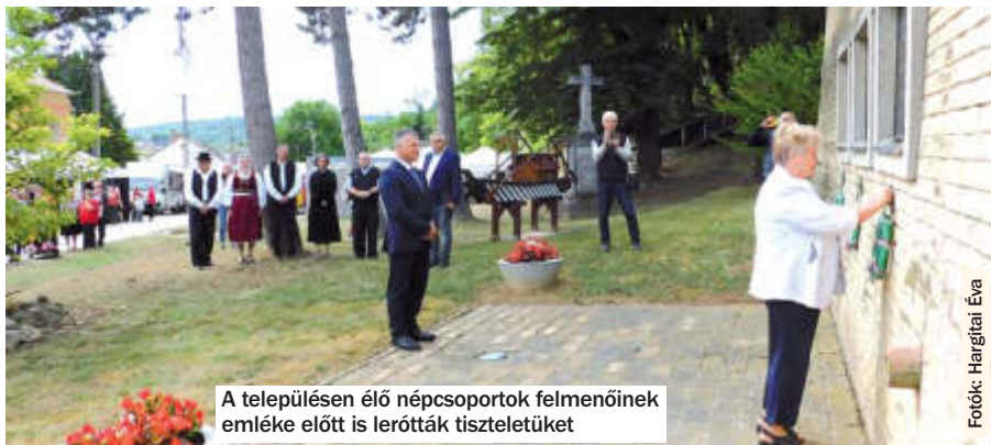
A településen élő népcsoportok felmenőinek emléke előtt is lerótták tiszteletüket

Kérékpárút kialakítására a Magyar Falu Program keretében nyertek 50 millió forint támogatást. Az összegből több utcában tudtak burkolatjavítást, padkarendezést megvalósítani, táblákkal, figyelmeztető jelzésekkel jelölték ki a kérékpárosok által használandó nyomvonalat.