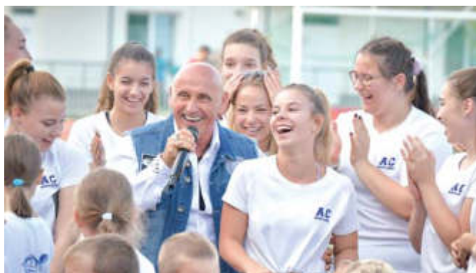
Pataky Attila, az Edda Művek frontembere szórakoztatta a közönséget