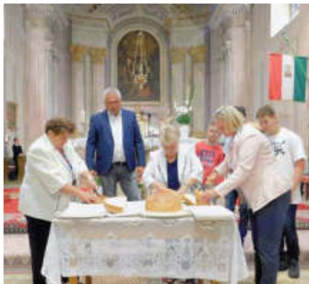
A Galsuka Fesztivál keretében, az ünnepi istentiszteletet követően felszelték a megszentelt kenyeret

Volt is mit ünnepelni, hiszen jelentős fejlesztések zajlanak a településen. A legnagyobb beruházást a falu központi árkanak helyreállítása jelenti. Erre európai uniós forrásból 378 millió forintot fordíthat a község 100 százalékos támogatottsággal. A vízvezetőt a Hőgyési utcától egészen a Mucsi-Hidas pa-