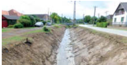
A jelenleg zajló legnagyobb beruházás és munka a település központ árkanak rendbetétele

takig rendbe teszik, a szakasz egyharmad részén csak kikotorják a medret, a fennmaradó kétharmad részen pedig gabion kövel is burkolják.