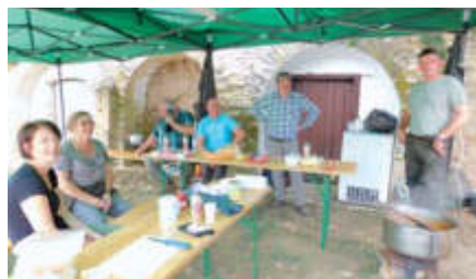
A rendezvénytéren főző társaság révén nagyon finom illatok lengték be a környéket