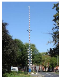
A régi májusfa Bonyhád főterén